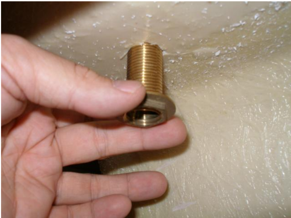
Bild 3 Skruva fast kranen underifrån med avsedd bricka