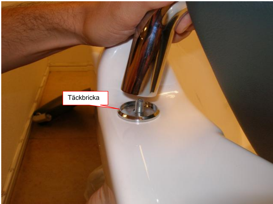
Bild 10 Trä skruvarna underifrån och skruva fast