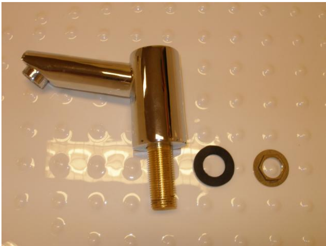
Bild 1 Kran med packning och mutter