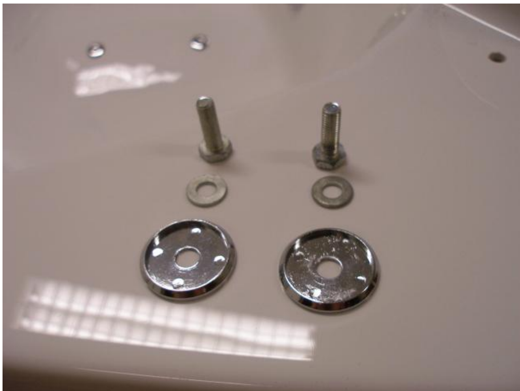
Bild 8 Skruv och brickor till Nackstödet