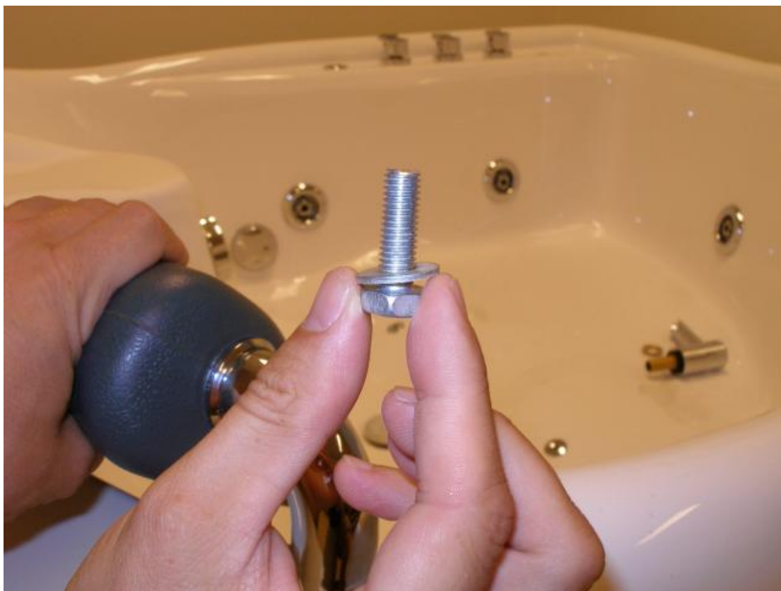
Bild 9 Skruv och Mutter