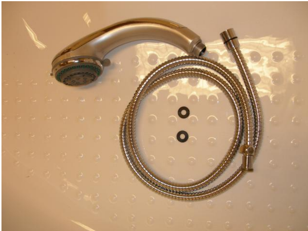
Bild 5 Duschmunstycke med slang