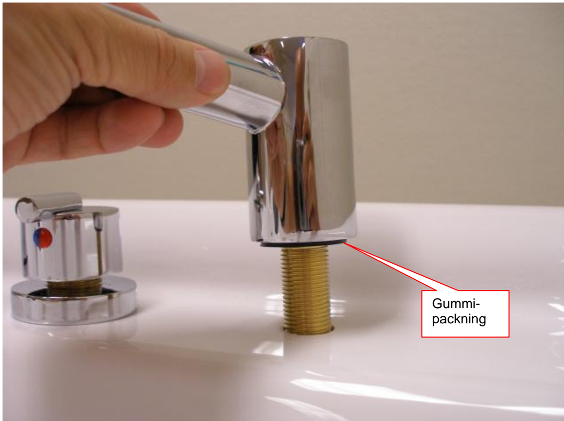
Bild 2 Trä på gummipackning och sätt i Kranen i avsett håll.