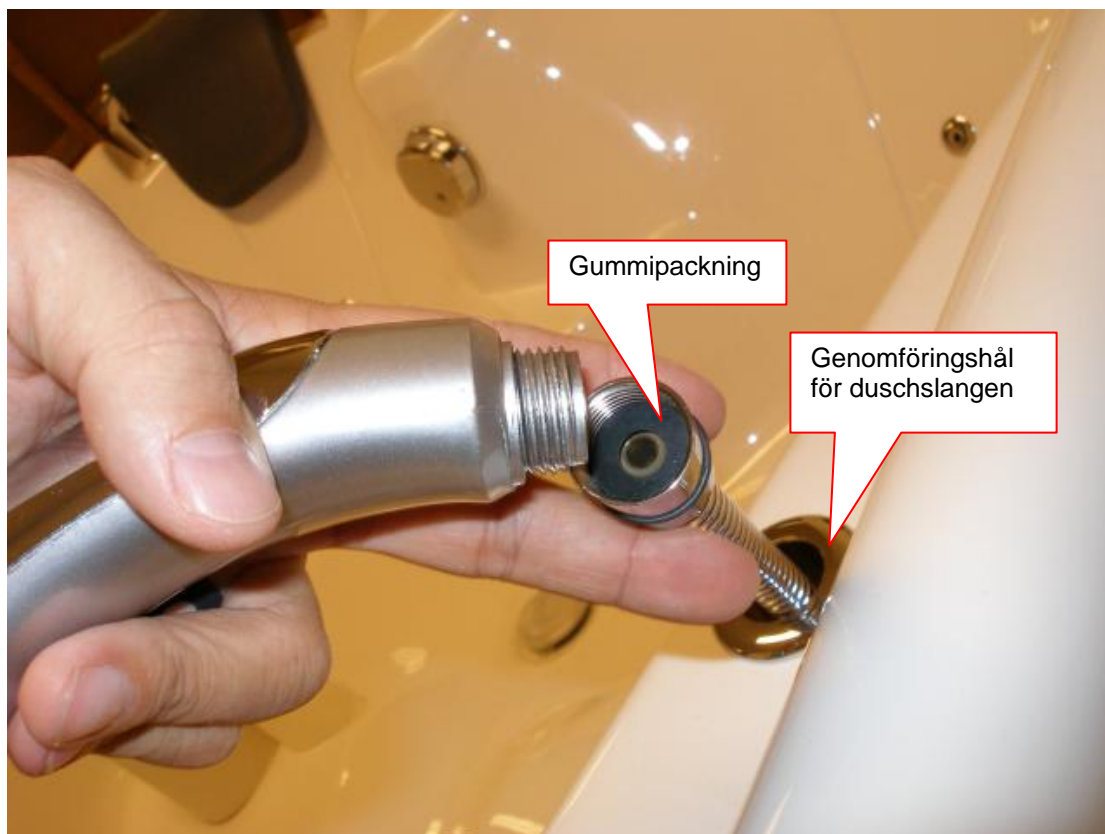
Bild 6 Trä igenom Slangen i genomföringshål för duschslang, montera slang-duschmunstycke.